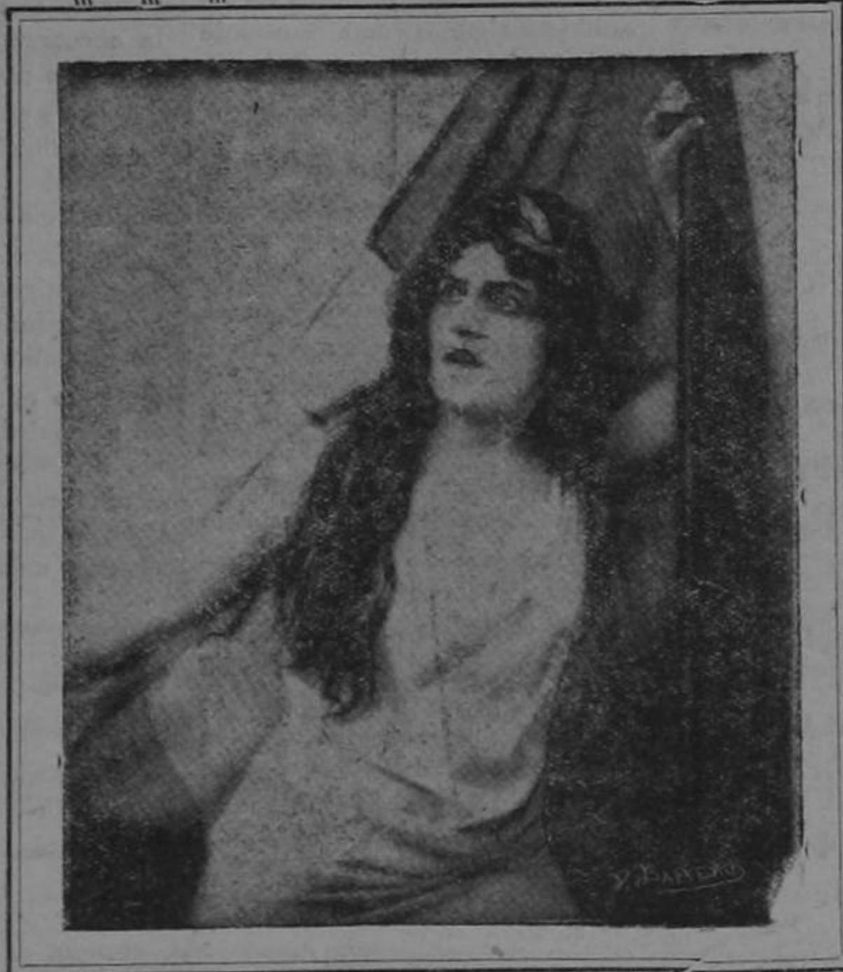
Honor a la Colonia Francesa